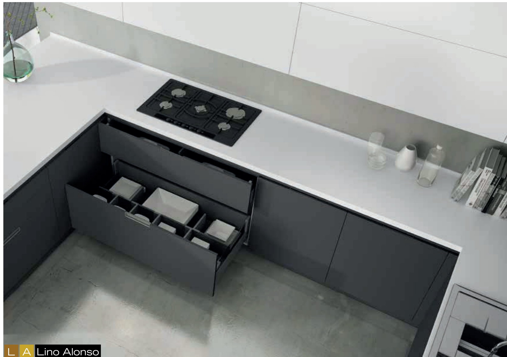
L A Lino Alonso